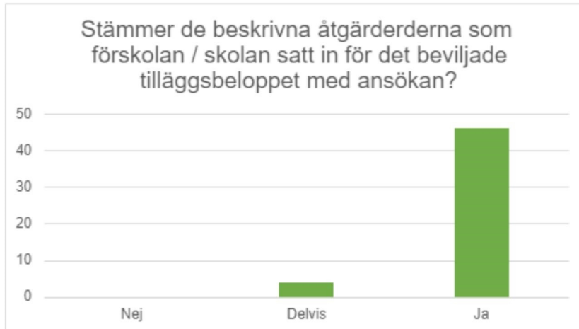
Tabell 1. Resurssamordnarnas bedömning efter intervju med förskolor/skolor

Resurssamordnarnas analys är att åtgärderderna i ansökningarna om tilläggsbelopp stämmer väl med det som respondenterna i förskolor och skolor redogjort för i intervjuerna och dokument. Den beskrivna planerade åtgärden stämmer i de allra flesta fall väl överens med den faktiska åtgärden.