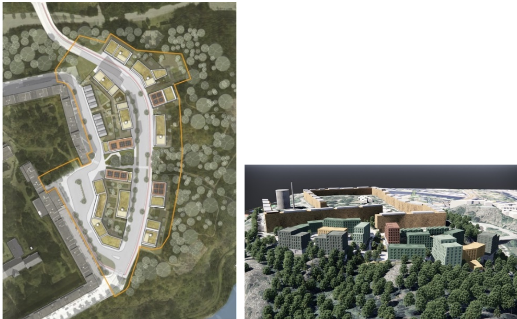
Figur 11 i planbeskrivningen. Situationsplan med kvartersnumrering och figur 12 Planområdets gräns redovisas med gul linje. Bild: AIX arkitekter