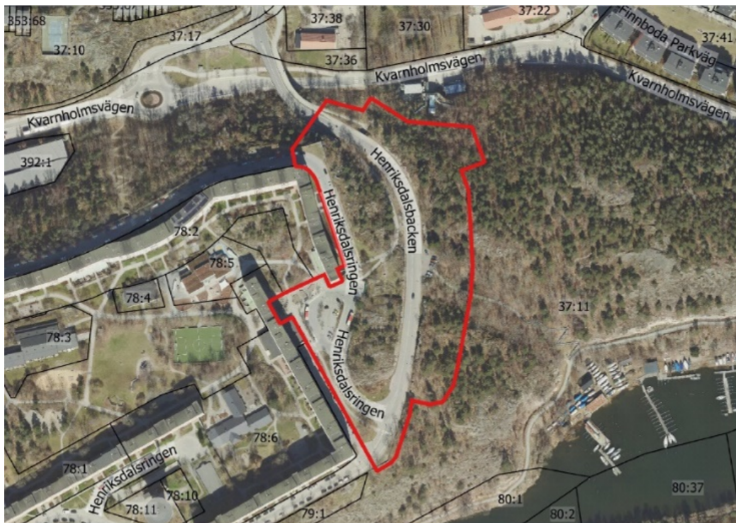
Figur 1 i planbeskrivningen: Kartan visar ett flygfoto över planområdet. Röd linje anger planområdets ungefärliga gräns.

Nacka stad kallas det nya, täta och blandade området som skapas på västra Sicklaön där projektet ingår. Projektet är beläget på Henriksdalsberget öster om Henriksdalsringens befintliga bebyggelse och innebär att en del av ett obebyggt naturområde tas i anspråk för bebyggelse. Bebyggelse föreslås på båda sidor av Henriksdalsbacken med cirka 450 bostäder, verksamheter och en förskola med fyra till sex avdelningar. Henriksdalsbacken får därmed en karaktär av stadsgata med byggnader som omger den på bägge sidor.